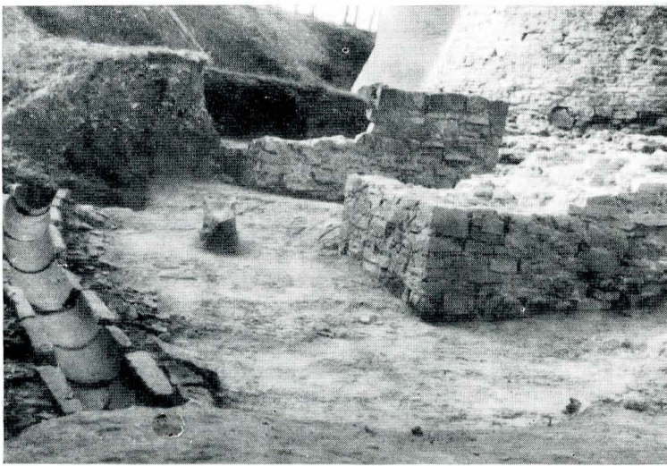
Fig. 1. Cetatea de Scaun a Sucevei. Baza picioarelor podului și o porțiune din igheabul de scurgere a apei.

Chiar dacă nu putem intra în analiza importanței factorului extern în cristalizarea și evoluția ulterioară a culturii materiale a poporului român, este, totuși, necesar măcar să amintim că, într-o formă sau alta, factorul amintit s-a manifestat cu rezultate deosebite și, cel puțin în ceea ce privește Țara Românească și Moldova, studiul comparativ al realităților rurale va semnala deosebiri ce nu vor dispărea decât în a doua jumătate a secolului al XV-lea. Pe de o parte, permanența și intensitatea raporturilor culturale ale Țării Românești cu lumea bizantină, pe de altă parte prezența cu urmări negative a tătarilor în nemijlocita apropiere a Moldovei, au constituit tot ațiția factori care au acționat asupra evoluției celor două provincii istorice românești cu efecte contrare. Aceste efecte au avut ca domeniu de manifestare nu numai cultura materială în sensul cel mai strict al cuvântului, ci și pe acela de importanță covârșitoare pe care îl constituie organizarea vieții statale la răsărit și sud de Carpați, în acesta din urmă înregistrându-se același decalaj mereu favorabil Țării Românești.